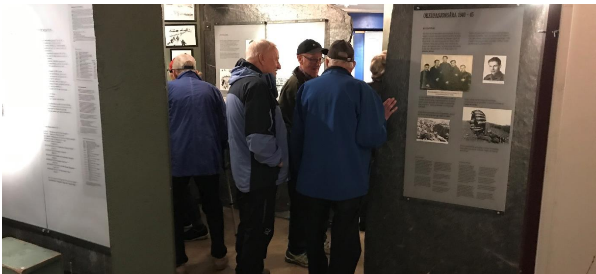
Trengsel og engasjement når prosjektet inviterte målgruppa til besøk og omvisning på Gudbrandsdal Krigsminnesamling.

Prosjektet samlet den mest vesentlige informasjonen på en egen side under nettsiden til KIL. Grunnet overgang til ny nettside for KIL i april 2020 er denne informasjonen å finne her . De tidligere rapporterte linkene til den forrige nettsiden fungerer derfor ikke lenger.