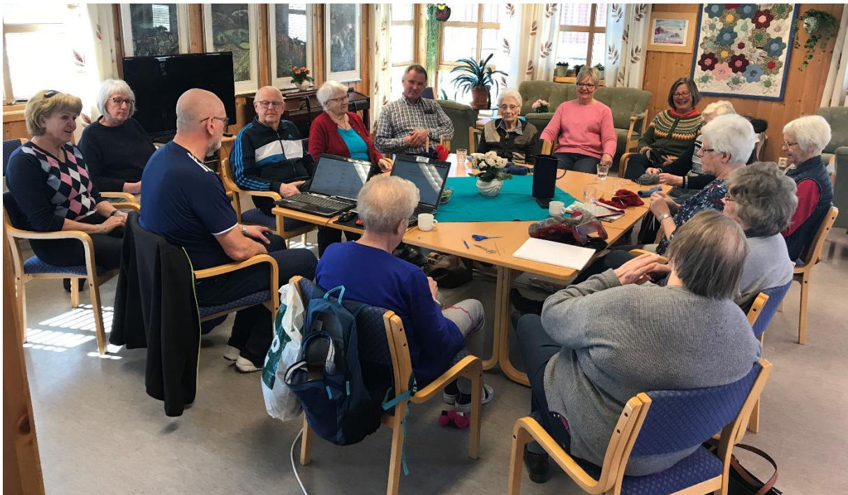
Stort fram møte på «Slektshistoriedag» på Kvamstunet.

Et av prosjektets hovedmål var å styrke tilbudet ved Kvamstunet, et aktivitetssenter for eldre i bygda. Prosjektet har hatt et veldig tett og godt samarbeid med Kvamstunet, og mange av våre aktiviteter har blitt lagt dit.