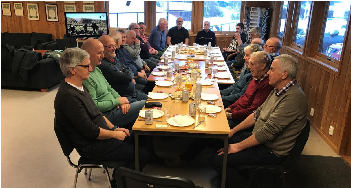
Julebord for veteranreffet.