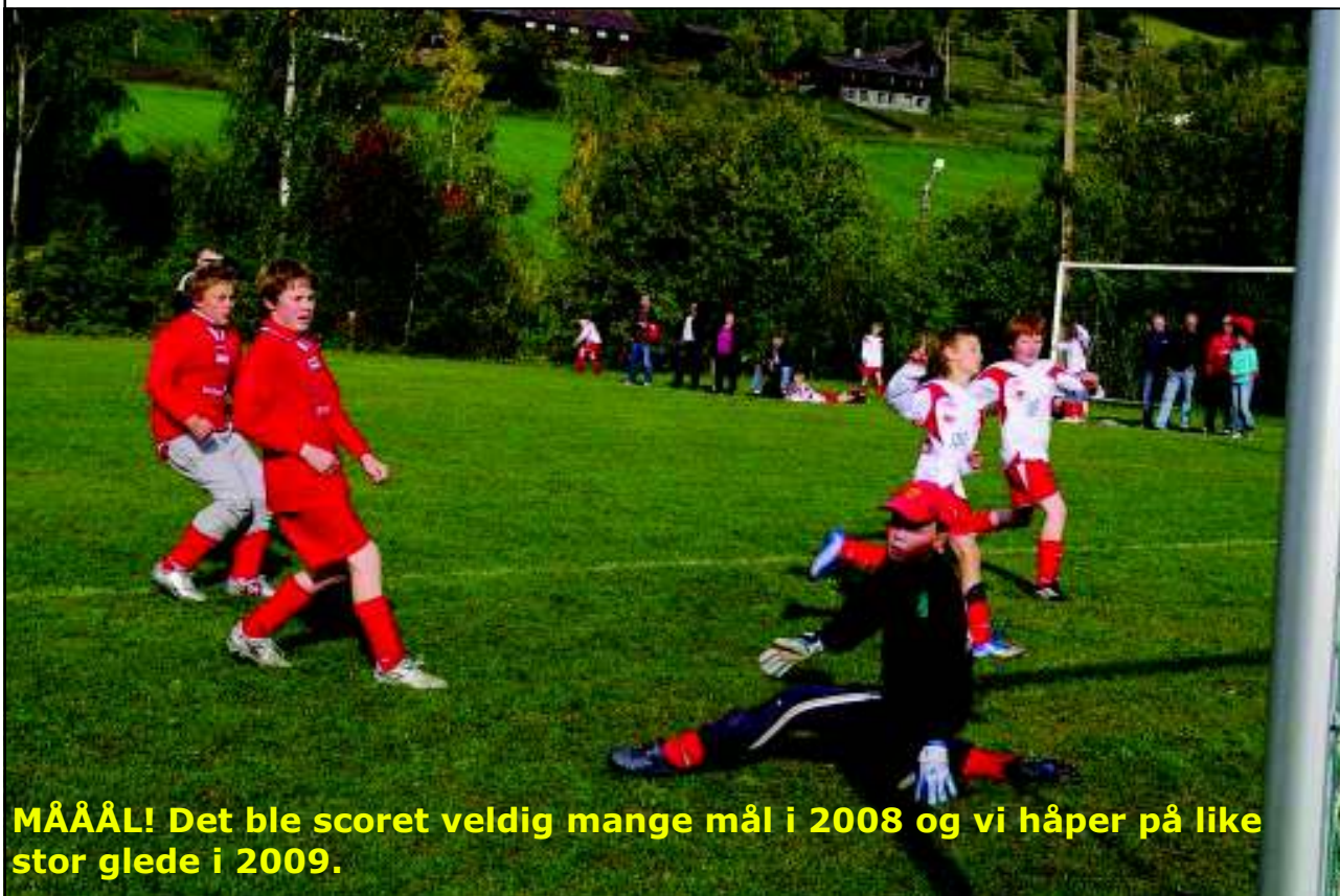
MÅÅÅL! Det ble scoret veldig mange mål i 2008 og vi håper på like stor glede i 2009.