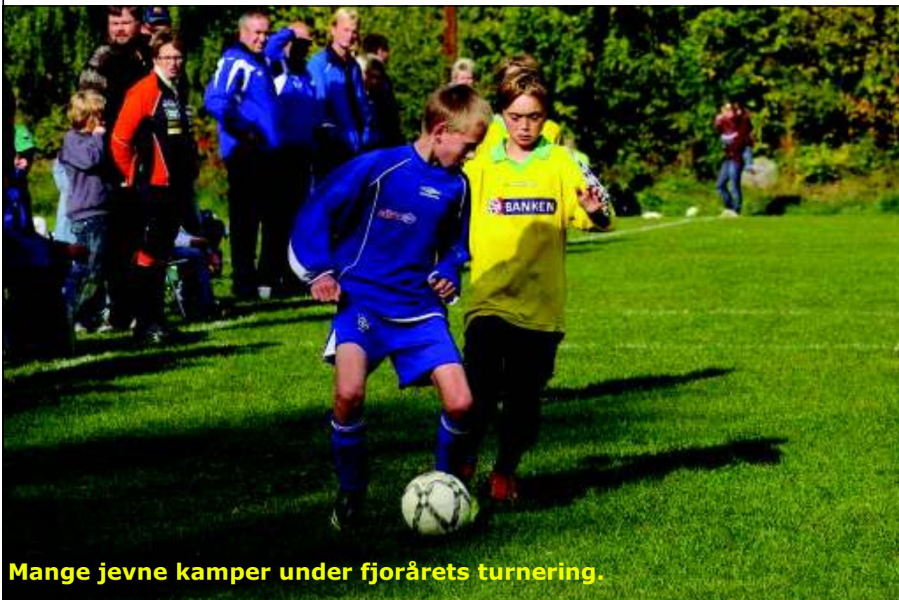
Mange jevne kamper under fjorårets turnering.