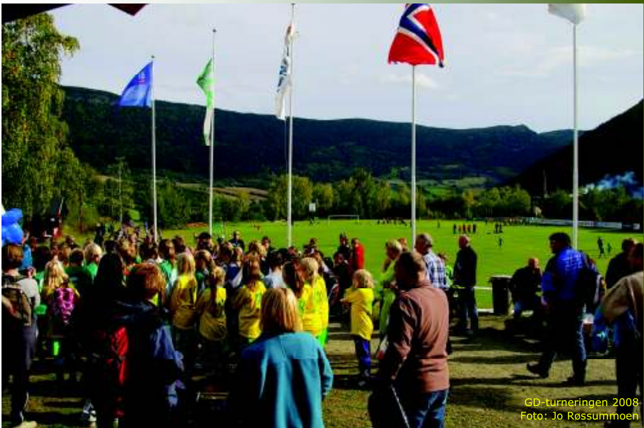
GD-turneringen 2008